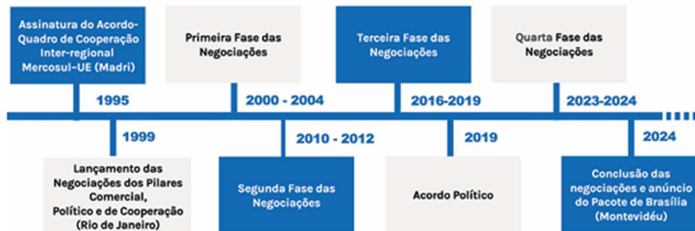
FIGURA 1 – Linha do tempo da negociação do Acordo de Parceria Mercosul-União Europeia até sua conclusão e próximos passos do Acordo de Comércio Interino até a entrada em vigor