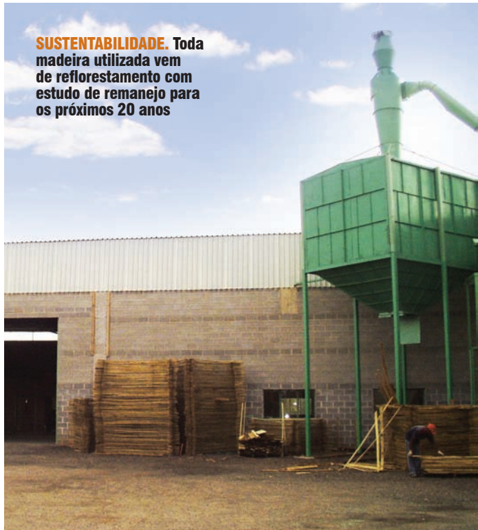
SUSTENTABILIDADE. Toda madeira utilizada vem de reflorestamento com estudo de remanejamento para os próximos 20 anos