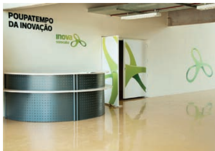
POUPATEMPO. Empresário terá um espaço onde irá receber assessoria para inovar