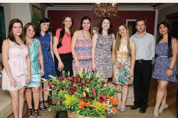
Equipe Ciesp Sorocaba