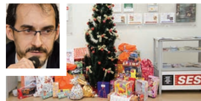
DOAÇÃO. Empreendedores disseram sim à campanha de brinquedos do NJE

destacou a importância de eventos desse tipo, lembrando que ele mesmo já participou de um curso do Núcleo há alguns anos, quando ainda não fazia parte do Ciesp.