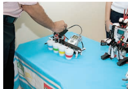
IDEIAS. Lego Educational é uma das empresas da área onde ficam incubadoras