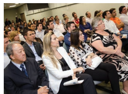
ENVOLVIMENTO. O palestrante cativou o público